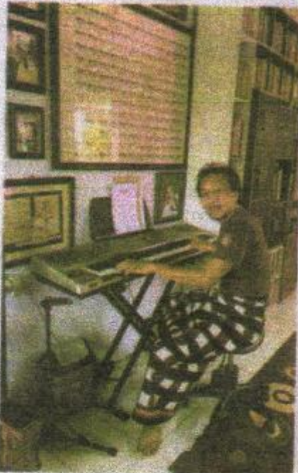
Nyocogake melodi nganggo keyboard.