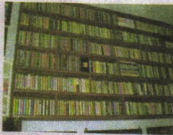
Koleksi kaset lawas ditata racak.

dadi luwih gampang. Nadyan kanca utawa bekas adhik kelas nanging ngujine tenanan. Ya dikon mbenerake metodologine, ngrevisi bab-bab kang wigati. Cekake, ora kok banjur digegampang. Tetep wae ora beda karo promovendus-promovendus liyane.