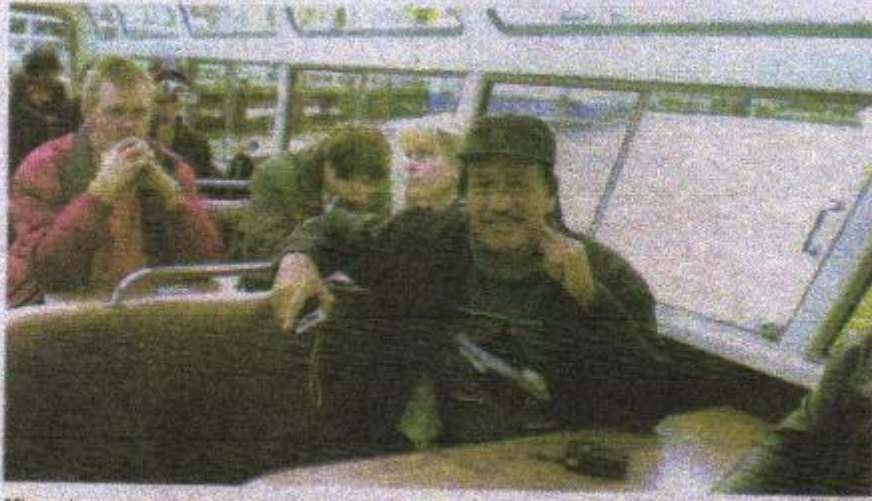
Mburu keroncong tekan negara Walanda

sumber inspirasi lagu karyane Gesang adhedhasar teorine Lucian Goldmann, strukturalisme genetik.